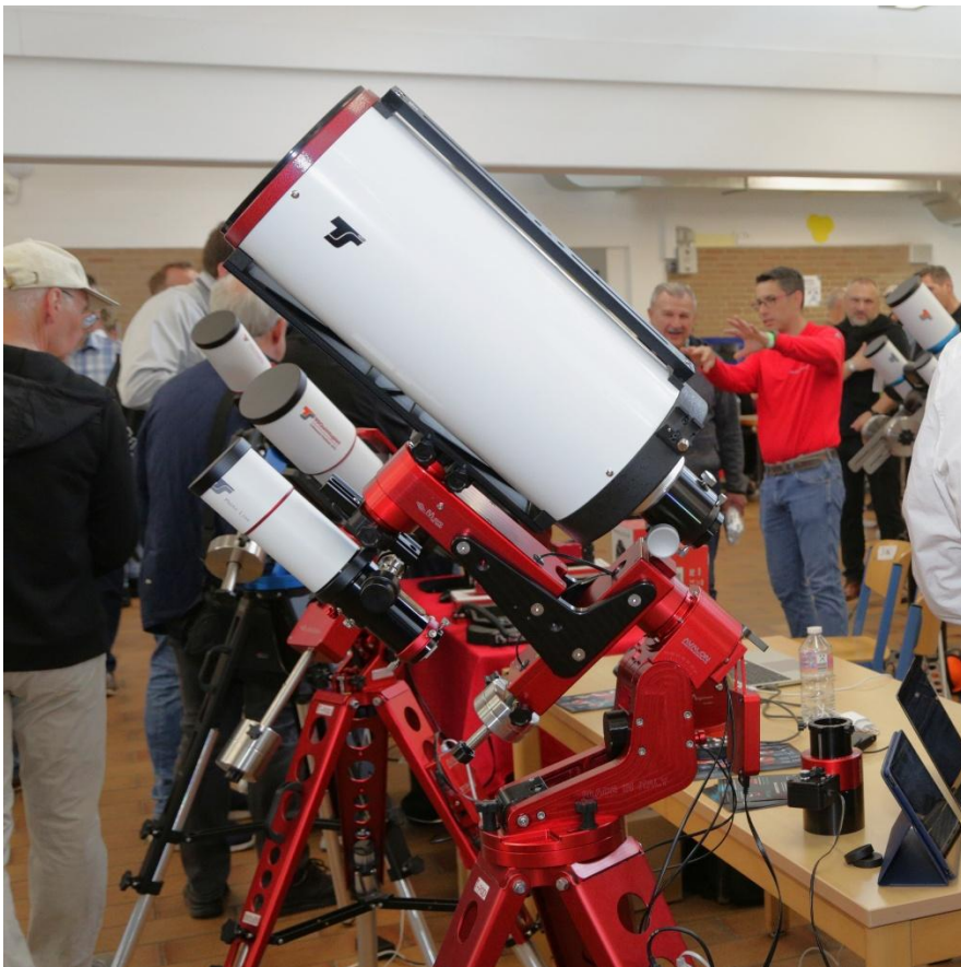
Teleskope und mehr