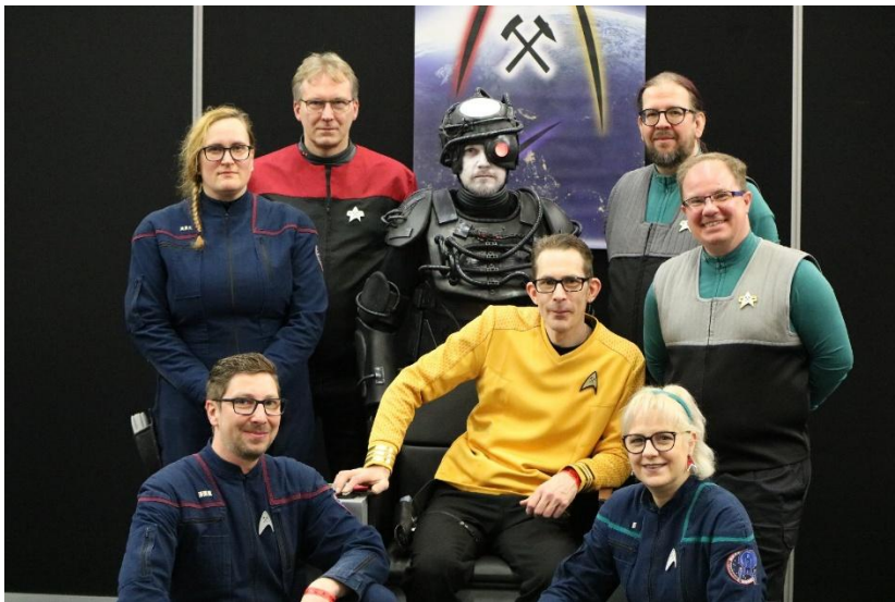
Trekdinner Ruhrpott