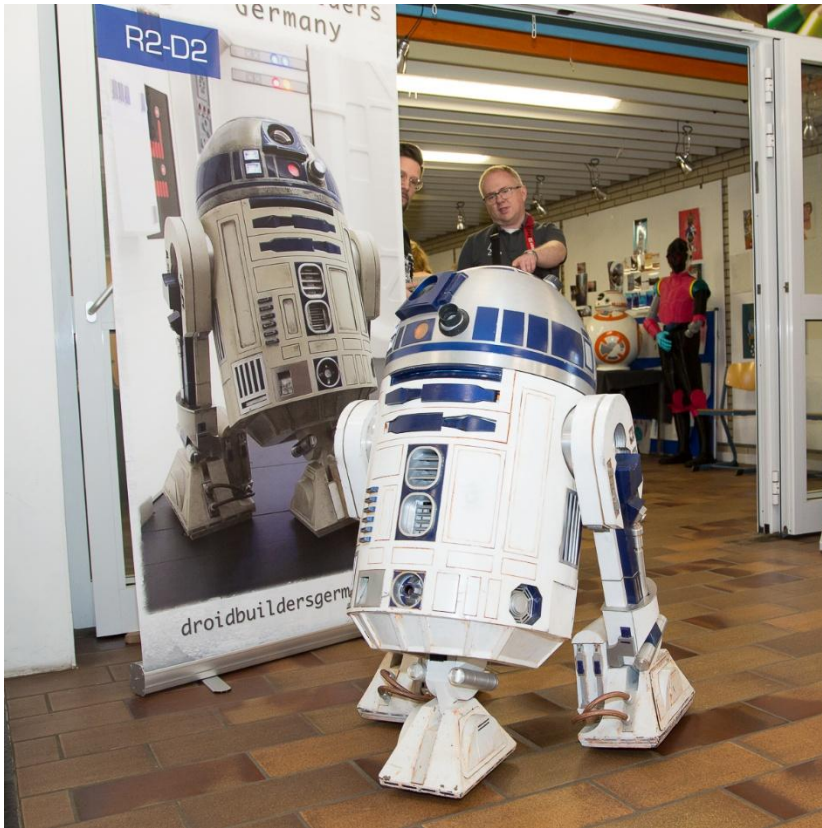
Droidbuilders Germany